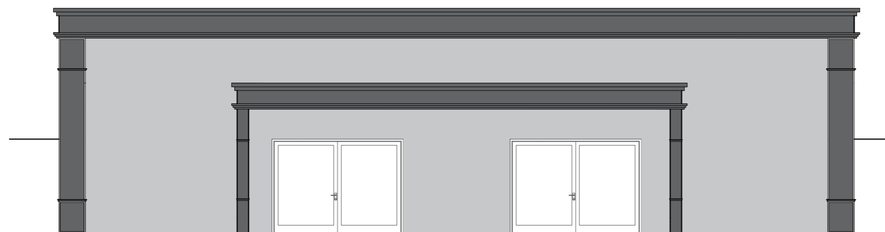
FACHADA ESC.: 1:100