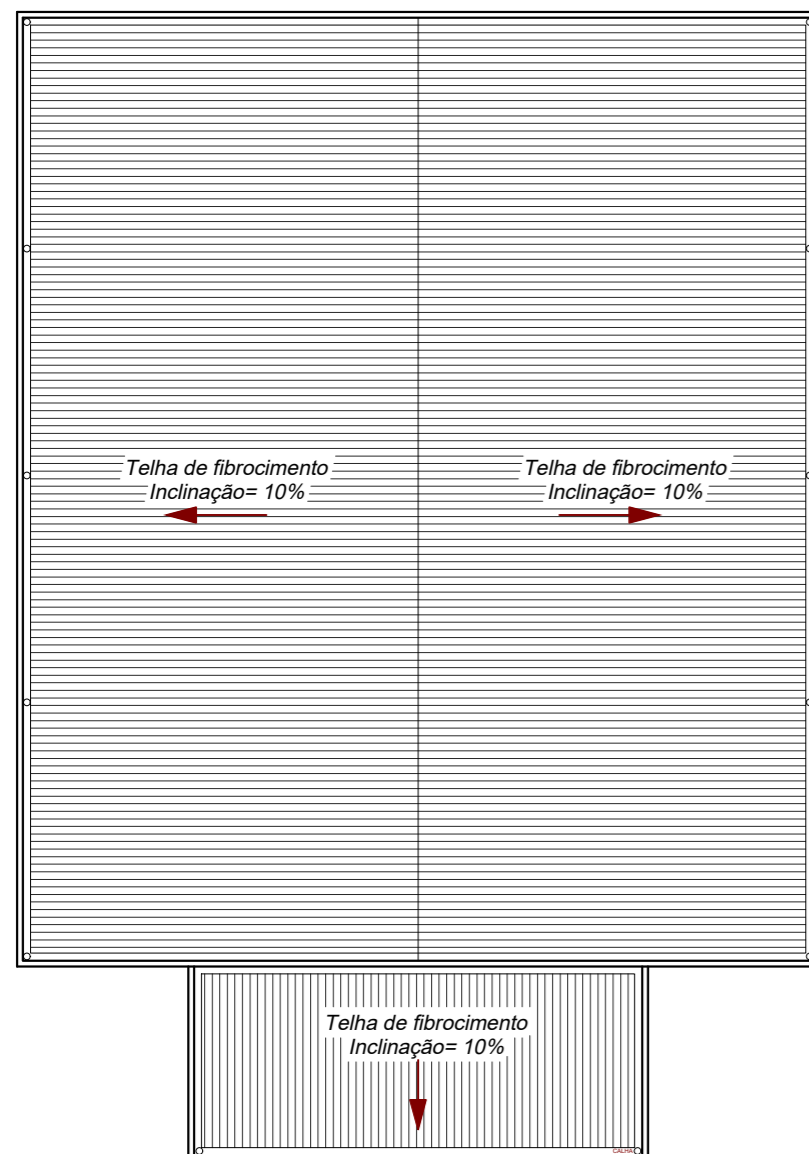
PLANTA DE COBERTURA ESC.: 1:200